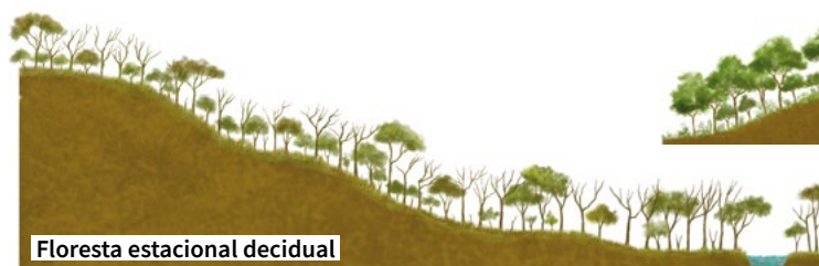
Floresta estacional decidual