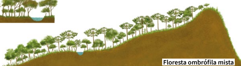
Floresta ombrófila mista