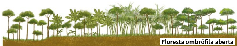
Floresta ombrófila aberta