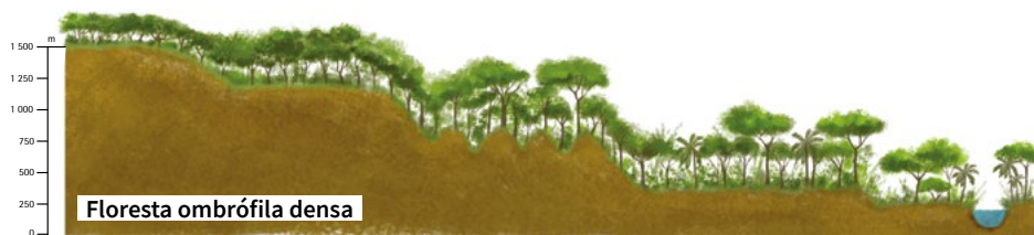
Floresta ombrófila densa