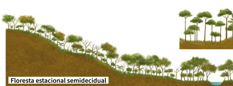
Floresta estacional semidecidual